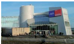
Am Schokoladenmuseum 1, direkt am Rhein, Haltestelle Heumarkt oder Severinstr.

Auf der Bühne erwartet sie ein köstlicher, unterhaltsamer Mix aus berührenden und mitreißenden Auftritten von Gruppen und Künstlern aus den Bürgerzentren, gespickt mit Auftritten prominenter Freunde der Häuser! Hier erfahren Sie ein paar Hintergründe über die Bühnenaktiven. Den genauen Zeitplan entnehmen Sie bitte der Tagespresse oder im Internet unter www.koelnerelf.de